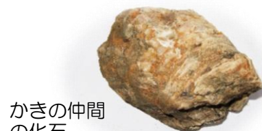
かきの仲間 の化石