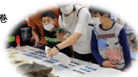
どんな化石が見つかるのかな？

8月7日、2021年度の少年少女化石探検隊がスタートしました。 今年度の隊員は、子供から大人まで総勢30名となりました。 かしま交流センターで開講式が行われ、相馬中村層群研究会の八巻会長から地層の説明や採集出来る化石などの説明を受けました。 開講式後、採集場所へ移動し化石採集を開始しました。 今回の採集場所は、原町区深野のジュラ紀後期の地層で、アンモナイトの化石などが発見されています。 小雨が降る中での活動となりましたが、子供たちは元気いっぱい化石を探し始めました。